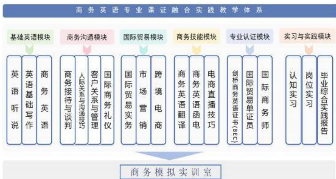
图9-2 “课证融合”实践教学体系

实践活动丰富多样，校内搭建模拟商务谈判、单证制作等真实业务场景，让学生在实践中巩固知识；校外与外贸企业、跨境电商平台等合作建立实习基地，学生能在实际岗位上锻炼，参与进出口业务、客户服务等工作，积累实操经验，使理论知识与实践深度融合，提升就业竞争力，实现从校园到职场的顺畅衔接。