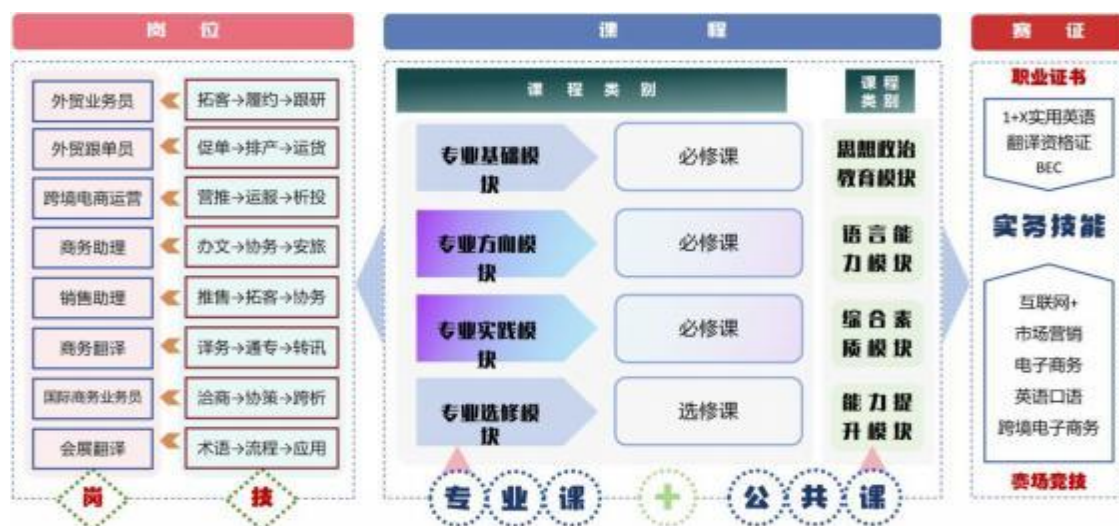
图9-1 “工学结合·理实一体”课程体系

高职商务英语专业“工学结合·理实一体·课证融合”实践教学体系，紧密围绕培养适应市场需求的复合型人才这一目标。通过将职业资格证书考核内容融入日常教学，让学生在获取学历证书同时，有能力考取 1+X 实用英语交际职业技能等级证书、翻译资格证书等行业认可度高的证书。