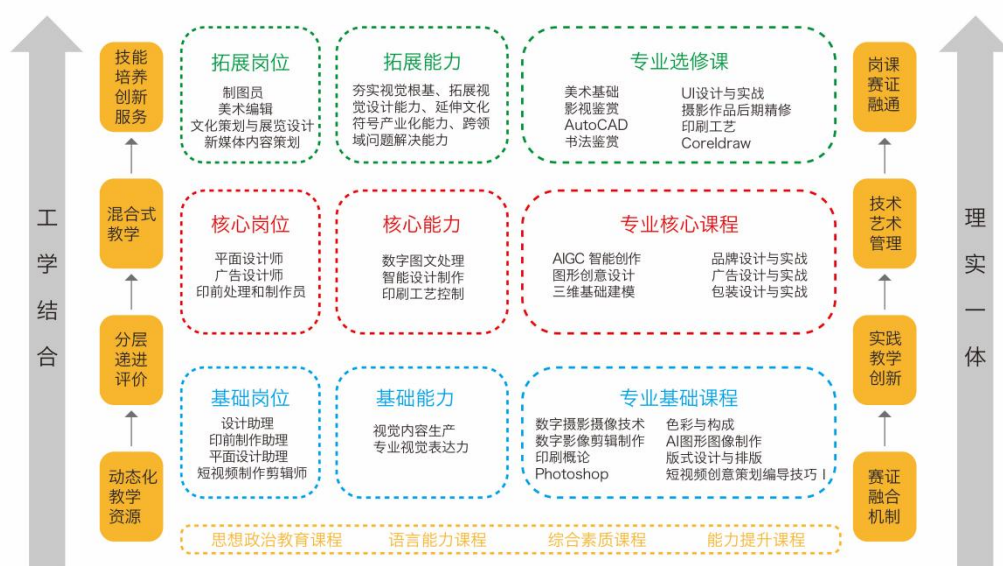
图 1 “技能训练、项目整合、岗位对接”课程体系

了核心的视觉内容获取与创作能力,奠定了关键的动态内容处理与表达能力基础;专业基础模块通过印刷概论、PhotoShop、色彩与构成、AI 图形图像制作、版式设计排版为专业核心课程提供理论和技能支撑的基础课程;专业方向模块则深入到了短视频创意策划编导技巧I、三维基础建模、图形创意设计、AIGC 智能创作、品牌设计与实战、广告设计与实战、包装设计实战等具体领域,使学生掌握行业前沿技术;专业实践模块强调理论与实践的结合,通过认识实习、岗位实习(1)、岗位实习(2)、岗位实习-毕业综合实践报告等项目,提升学生的实战能力;而专业选修模块则提供了美术基础、AutoCAD、UI 设计与实战、印刷工艺等丰富多样的课程,满足学生个性化发展需求。