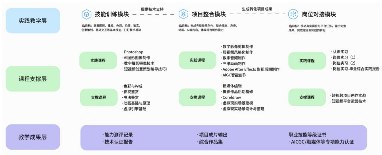
图2 课证融合实践教学体系

在专业实践体系方面，本专业构建以“岗位能力导向”为核心的三层递进式实践教学体系，贯穿“技能训练—项目整合—岗位对接”三个教学模块，层层递进、螺旋上升，最终实现学生从能力掌握到成果转化、再到岗位适应的全过程实践育人目标。