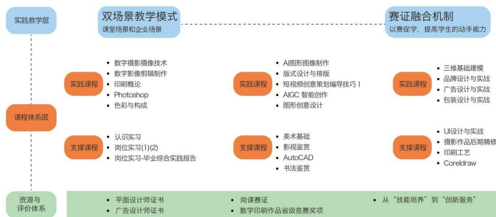
图 2 课证融合实践教学体系