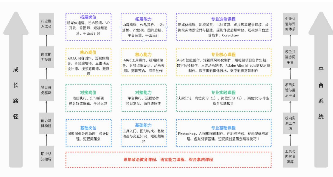
图 1 “技能训练、项目整合、岗位对接”课程体系

支撑系统方面，依托“工具与资源平台—校内实训场所—项目实验平台—校企协同平台—企业认证体系”五层平台系统，提供从学习资源到实战转化的全流程支撑，推动学生从认知启蒙到行业融入的能力成长，实现课程体系与岗位需求、证书认证的高度对接。